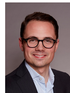
Simon Aggesen Borgmester

Integrationspolitikken er blevet til i samarbejde med en bred kreds af samarbejdspartnere, herunder Integrationsrådet, der er kommet med værdifulde input. En stor tak til alle, der har bidraget. Sammen har vi nu en opgave med at få politikken til at leve og sikre en reel integration. Det kan vi kun gøre i samarbejde med byen, fællesskabet og med respekt for den enkelte.