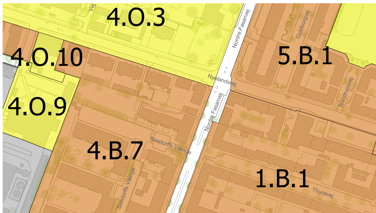
Eksisterende rammeområde 4.B.7